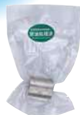
特殊ねじ込み継手 (変換ソケット)