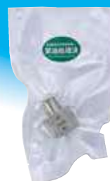
特殊ねじ込み継手 (オスメスソケット)