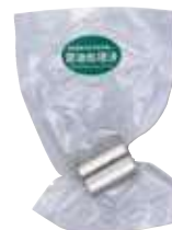
特殊ねじ込み継手 (ソケット)